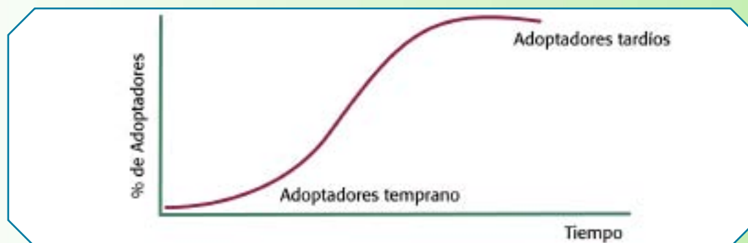
Figura 5. Curva de Adopción de Innovaciones según Rogers. Rogers, Everett. [2003], Diffusion of innovations . Fifth edition, Free Press. New York.

De acuerdo con los estudios realizados por Rogers, estas categorías de personas se distribuyen siguiendo