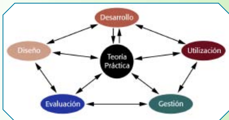
Figura 2. Relaciones entre dominios de la tecnología instruccional.

Seels, B y Richey R (1994) Instructional technology: the definition and domains of the field . AECT Publications. Washington, DC, USA. p. 27