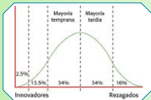
Figura 6. Categorías de adoptadores de una innovación y porcentaje de la población total de adoptadores. Rogers, Everett. (2003). Diffusion of innovations . Fifth edition, Free Press. New York.

una curva normal, como se muestra en la Figura 6 . Primero, encontramos una minoría muy pequeña de innovadores (2,5%) acompañada de un conjunto de adoptadores tempranos (13,5%). A éstos se agrega la mayoría temprana, que reúne aproximadamente 34%. Al final encontramos una mayoría tardía (34%) y un pequeño conglomerado de rezagados (16%).